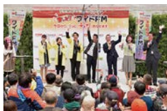
2016年3月19日 ワイドFM開局のAM3局合同イベント